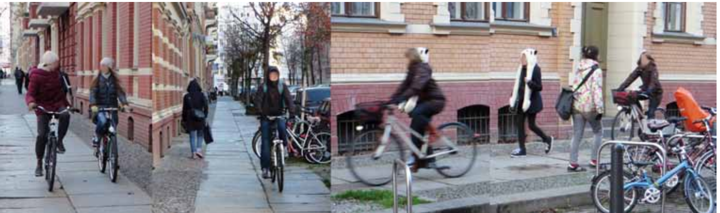
– Bürgersteig Gneiststraße am 1.12.15 fotografiert binnen einer Minute