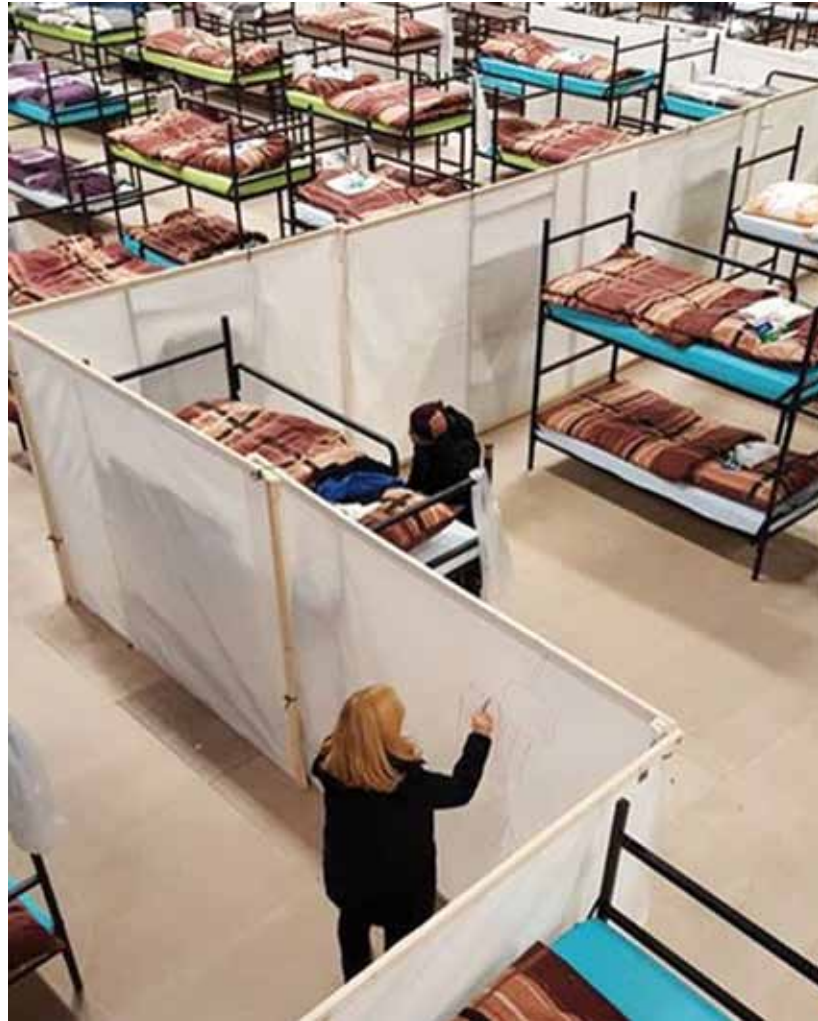
– Sporthalle Winsstraße 2.12.2015

Deshalb gibt es die Idee innerhalb der „Bremer Höhe“ eG einen Unterstützerkreis für Flüchtlinge zu gründen, um in einer offenen Runde zunächst