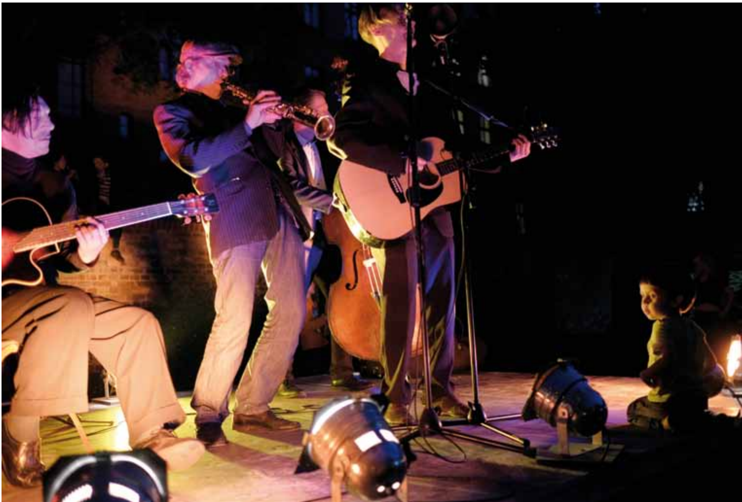
Sommerfest 2015, Das „Spreeorchester“ bot beste Unterhaltung