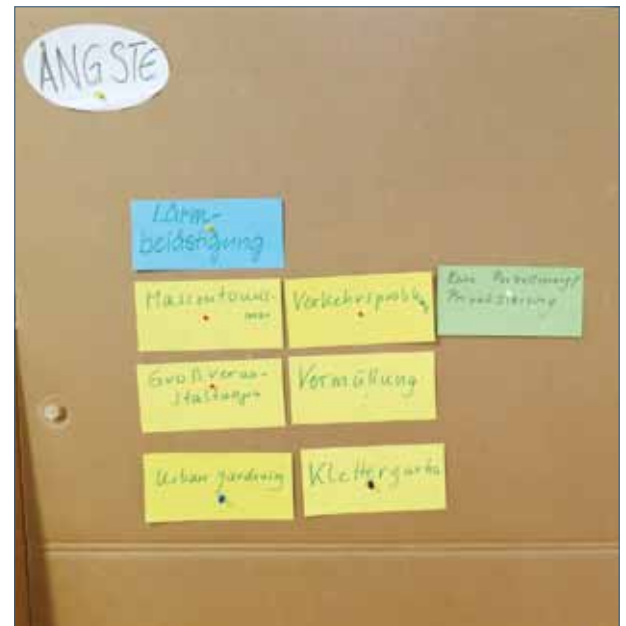
Workshop zur Gestaltung Gutsgelände in Hobrechtsfelde