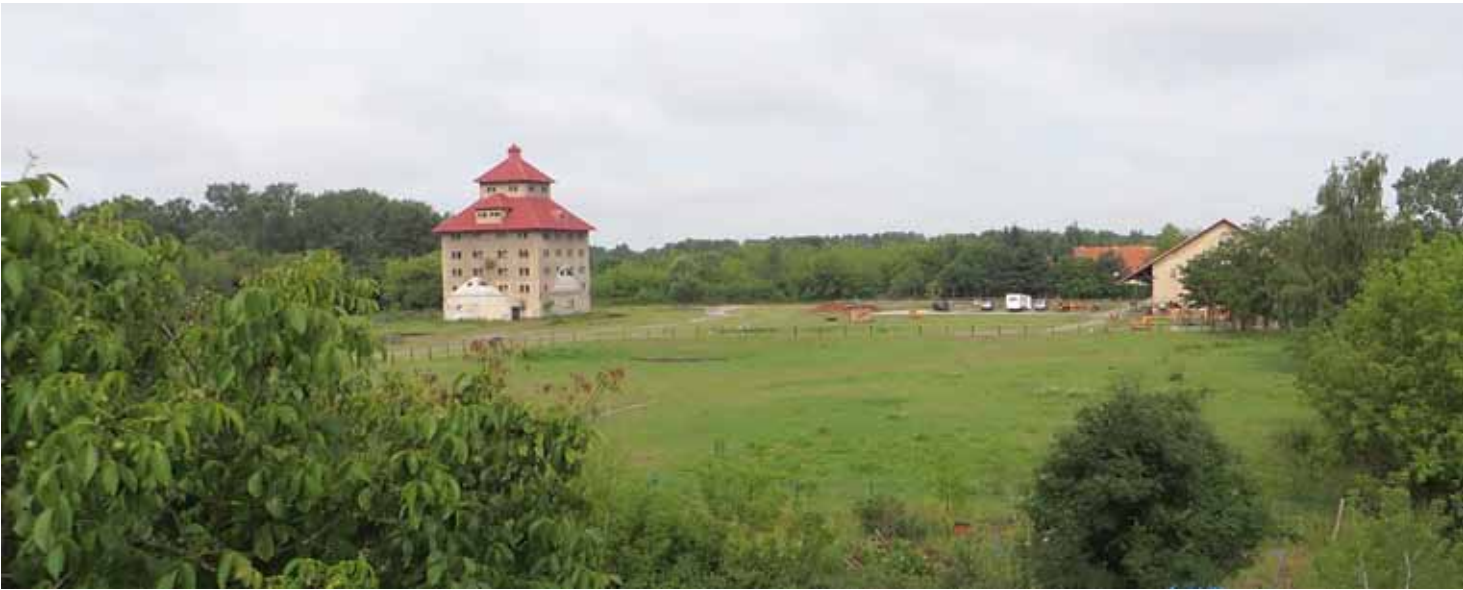
Der Streitgegenstand „Die Sibirische Weite“

Am 6.11. fand auf Einladung des Fördervereins Naturparks Barnim e.V. ein Workshop zur Entwicklung des Gutsgebietes in Hobrechtsfelde statt. An dieser Veranstaltung nahmen auch 11 Mitglieder der Bürgerinitiative Hobrechtsfelde teil.