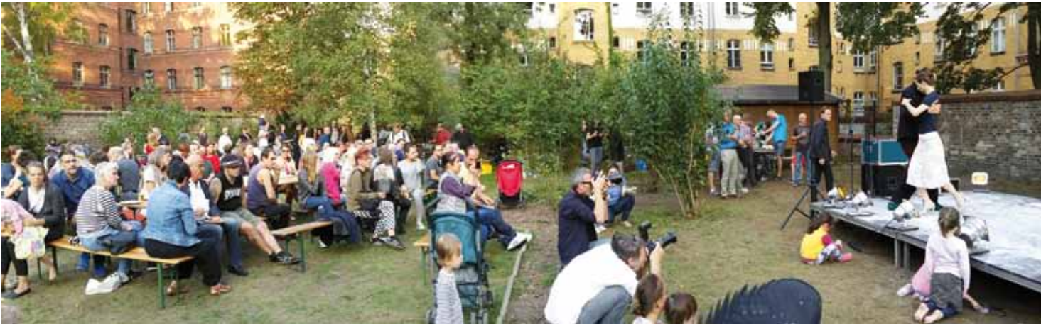
Das Sommerfest am 12. September war schön! Mehr dazu im nächsten Heft.