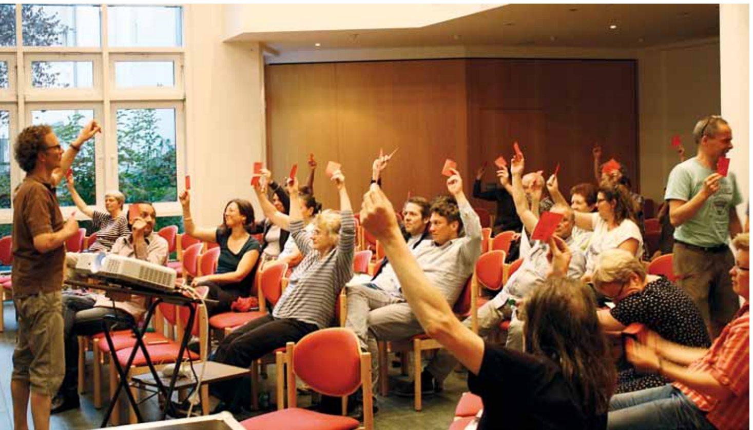
Mitgliederversammlung am 30. Juni 2015